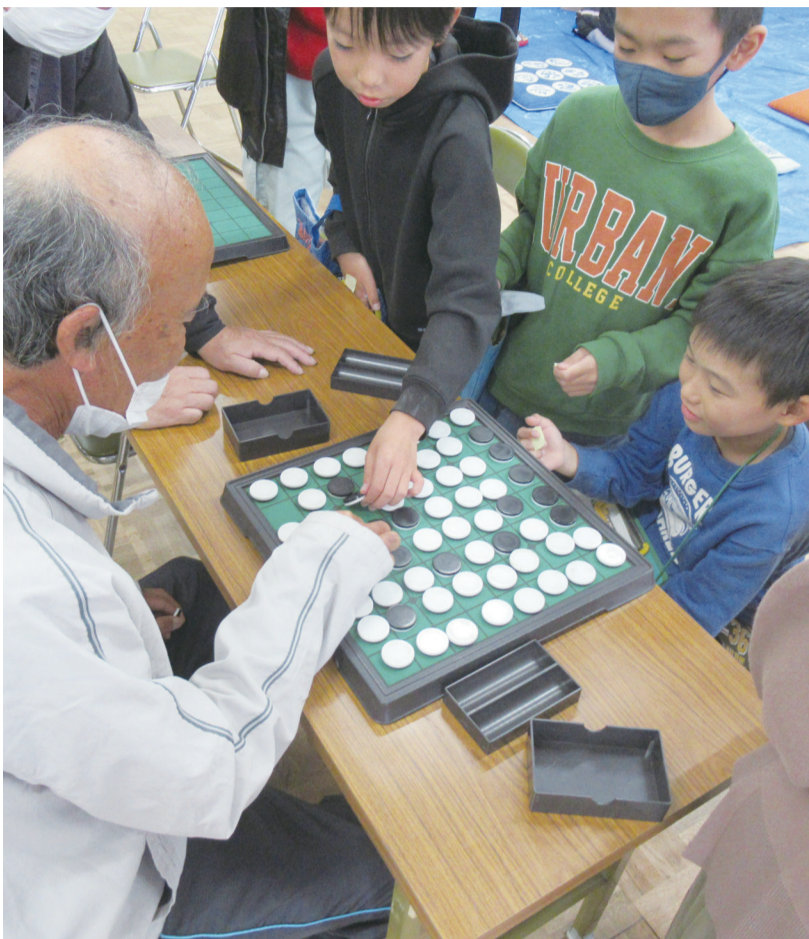
地区社協主催の「世代間交流事業」と小学校 PTA 主催の「ふれあいまつり」が合体した「社協 & PTA ふれあいまつり」で、民生委員とオセロで対局する子どもたち（久野地区）

私たちが暮らしている地域には、いろいろな団体が住みよい地域づくりをめざして、さまざまな活動を行っています。このような活動をより効果的に進めることを目的に、本市では、地域内の諸団体の参加による地区社会福祉協議会（地区社協）が市内 26 地区の自治会連合会を単位に組織され、お年寄りが安心して暮らすためのお手伝いや、お子さんの健全育成のための世代間交流事業など、住民の皆さんによる福祉活動が行われています。社協会費はそのための貴重な財源として活用されています。