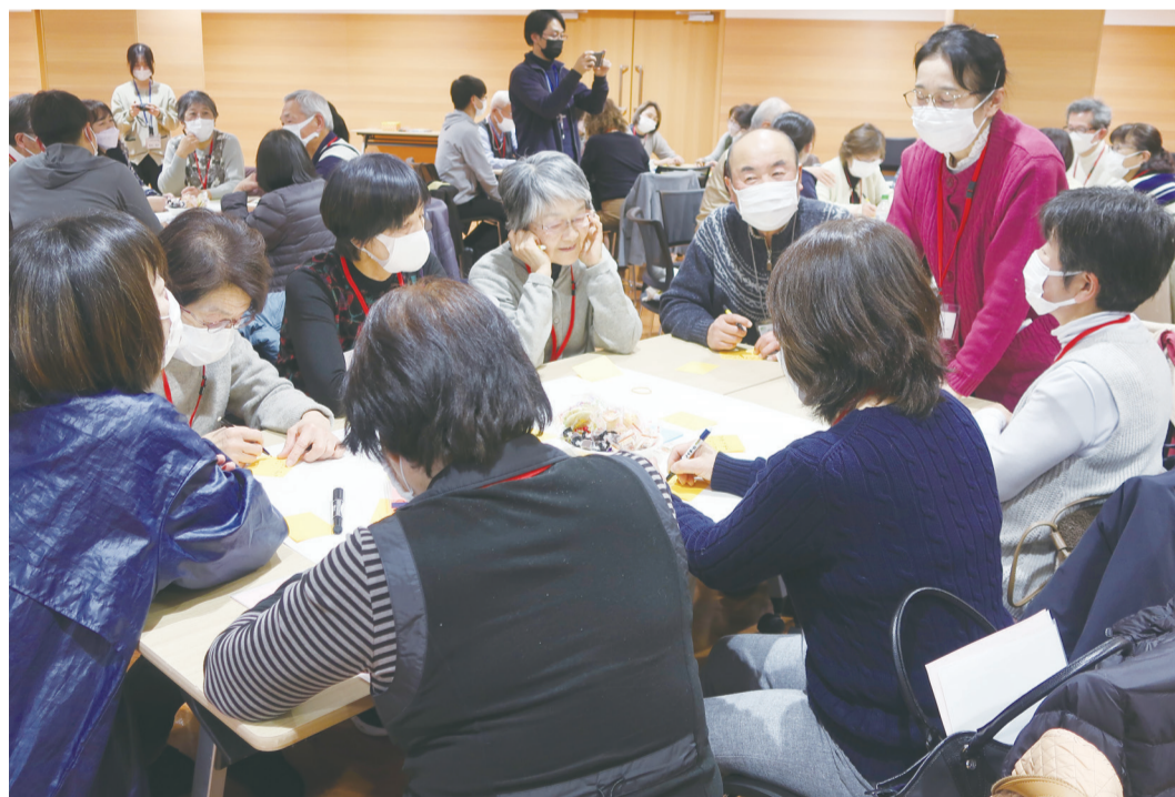
地域福祉コーディネーター養成研修会（市社協主催）を受講された人たちの交流会で、地域活動について意見を出し合う皆さん

小田原市全体では地区社協を構成する人たちは左表のとおりです。各種団体の役員や活動に関心のある人など、地域住民の皆さんが活動をしています。地区の実情により構成は変わりますが、多くの方が地区社協活動に参画しています。表中の「その他」には、サロン運営のみで地域活動に参加されている人や日赤奉仕団・農協・商業関係者などが含まれます。