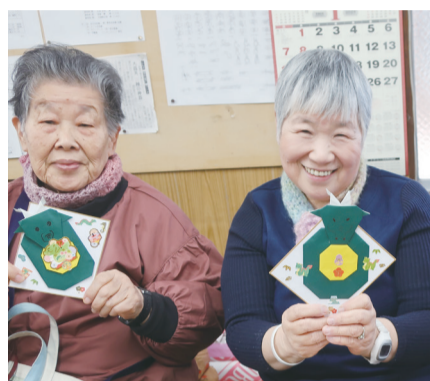
サロンでは今年の干支の色紙を作成（万年地区）

地区の実情に応じて取り組まれ、地区社協会長、自治会長、民生委員児童委員をはじめとする各種団体の連携のもと、きめ細かな対応が皆さんの安心感を支えています。