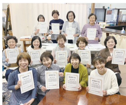
地区社協活動の一端を担う地域福祉コーディネーターの皆さんが、歯とお口の健康づくりを推進する研修（県主催）を修了（下曾我地区）