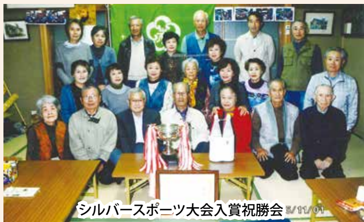
シルバースポーツ大会入賞祝勝会

『十字地区』は小田原城南側に位置するエリアで5つの自治会で構成されています。昭和40年当初から組織として活動を続けて、平成16年に組織替えが行われて、4つの老人クラブが活動を再開いたしました。令和の時代に入りコロナ禍があつて、クラブ活動は悉く中止に追い込まれて休眠状態になりました。