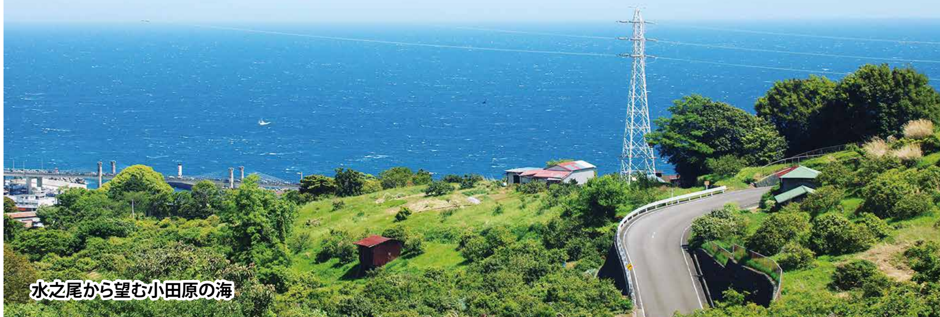
水之尾から望む小田原の海

最後に、会員の皆様方が今後益々ご精進されて、明るく未来の展望を語り合えるよう、ご協力の程、深くお願い申し上げますと共に、ご健勝を心より祈願しております。